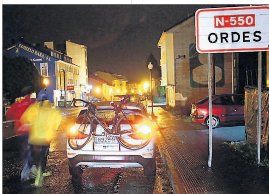
Entrando en Ordes, ya de noche. // Félix Méndez

ciudad herculina para emprender trayecto debido a que no pudieron estar con el Deportivo al tener ayer día de descanso. Pero la implicación de todo el deporte autonómico continuará a lo largo del día de hoy. Un encuentro con todos los que fueron compañeros de trabajo de "Lu" en A Coruña dará inicio a un día que, tras la carrera entre Ordes y Santiago, culminará con el aplauso unánime del Obradoiro de la Liga ACB que también quieren prestar su imagen a la causa. Para el viernes está prevista la visita al Celta. En definitiva, un reto que cuenta con la plena identificación de toda Galicia. Va por ti Lu.